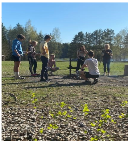
Pilt nr. 2. Ardu ELU projekt