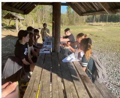
Pilt nr. 4. Ardu ELU projekt