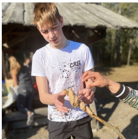
Pilt nr. 1. Ardu ELU projekt