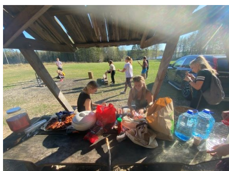
Pilt nr. 3. Ardu ELU projekt