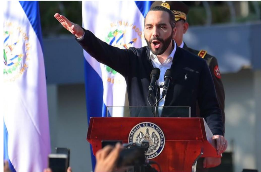
El Salvadori president Nayib Bukele 8. mai kõne ajal Žestikuleerimas

Pilt 3. Bukele kujutamine 2020. aastal (Hein 18.05.2020)