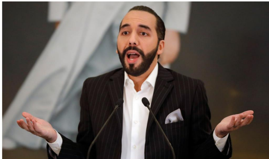
El Salvador president Nayib Bukele konverentsil esinemas

Põhiküsimus: kuidas kujutab Postimees 21. sajandi Ladinameerika tegelikkust nende riikide presidentidest rääkimise kaudu? Uurisime artikleid, kus mainitakse viimase 10 aasta presidente.