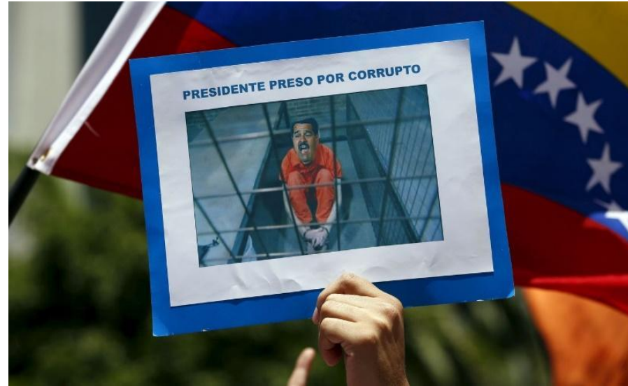
Pilt 4. President Maduro vangis kujutav plakat opositsiooni meeleavaldusel.