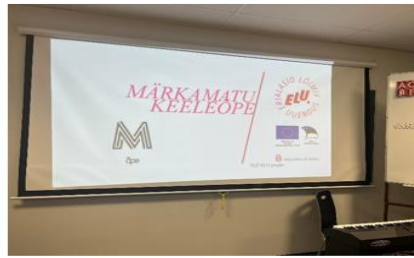
Joonis 2 Elu projekti tutvustus Tallinna Tondiraba huvikoolis