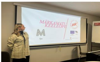
Joonis 3 Elu projekti tutvustus