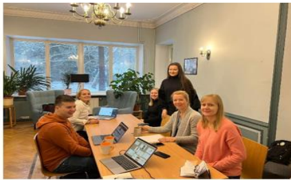
Joonis 1 ELU projekti tutvustus Nõmme Huvikoolis