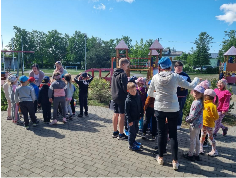
Foto 4. Grupitöö.