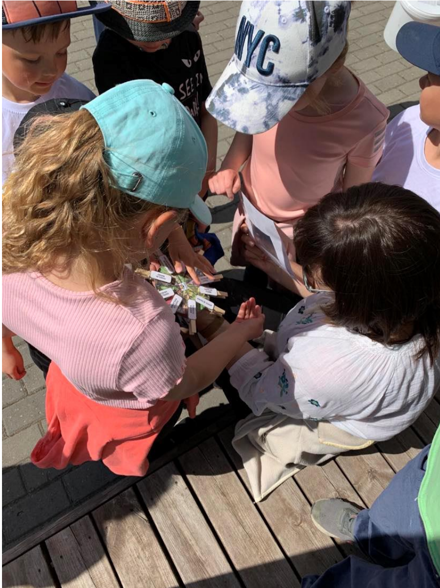
Foto 2. Lehemänguga tutvumas.