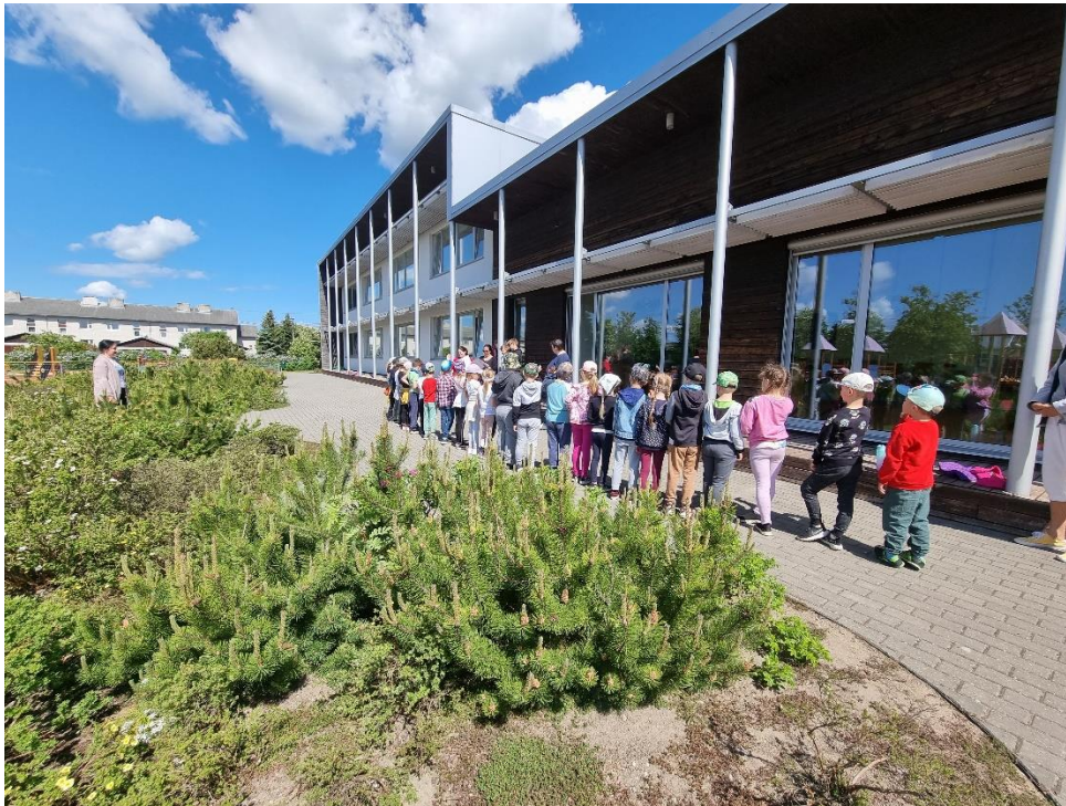
Foto1. Lapsed kogunevad tutvuma ja gruppidesse jagunema.

Lisa 9. Tutvustamise päeva fotod.