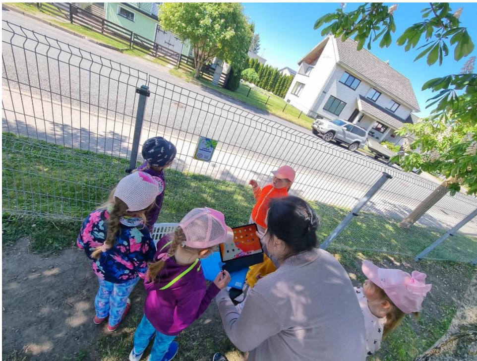
Foto7. Koodi lugemas 2.