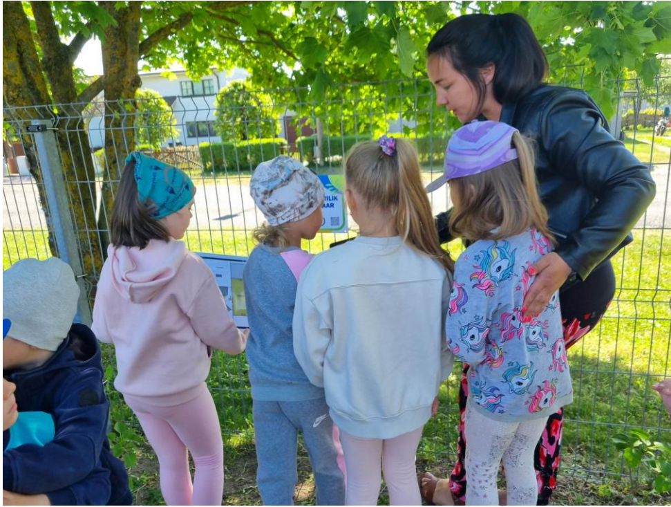
Foto 6. Koodi lugemas.