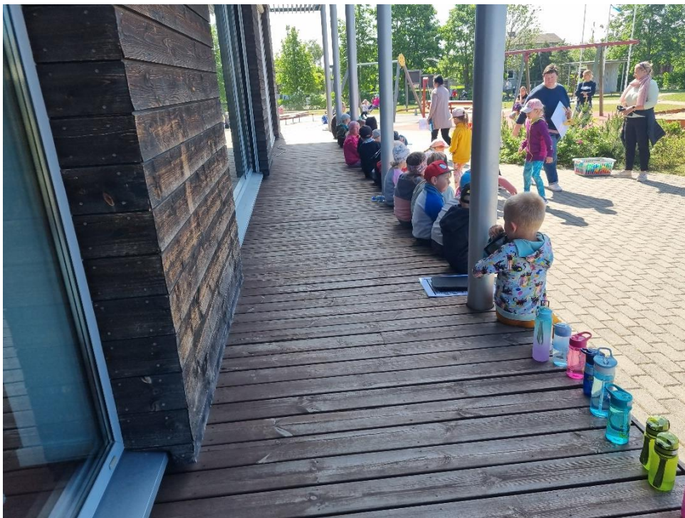
Foto 9. Taastumine varjus.