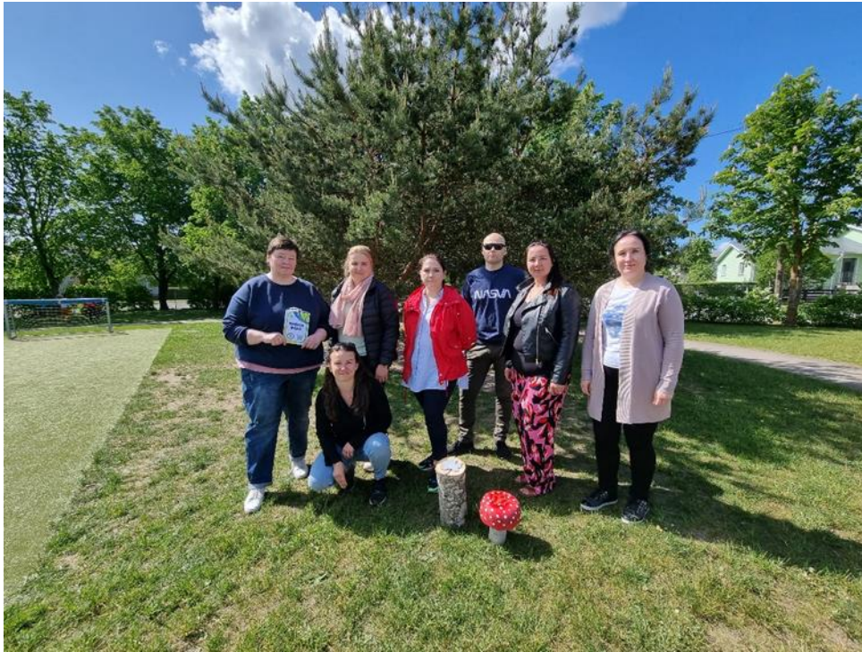
Foto 10. Meeskond koos makettidega.