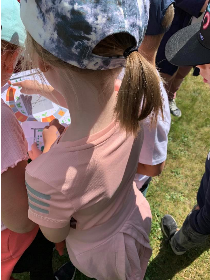
Foto 3. Kaardilugemise harjutused.