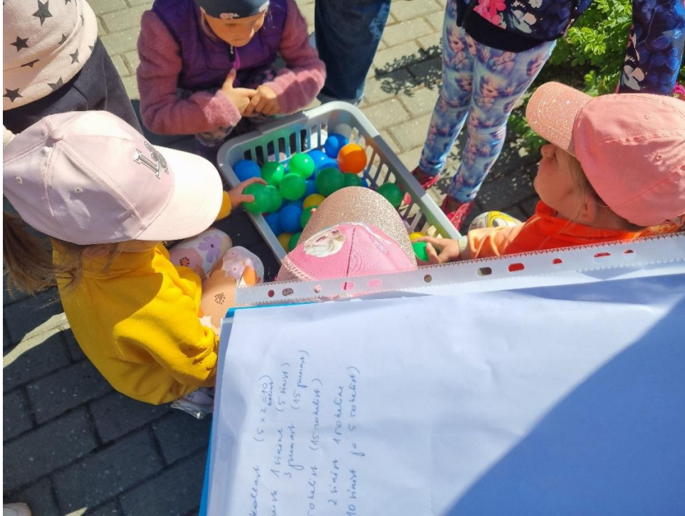
Foto 8. Loendamise ja meeskonnatöö harjutus.