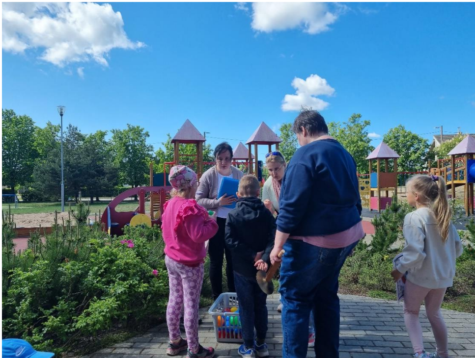
Foto5. Grupitöö 2.