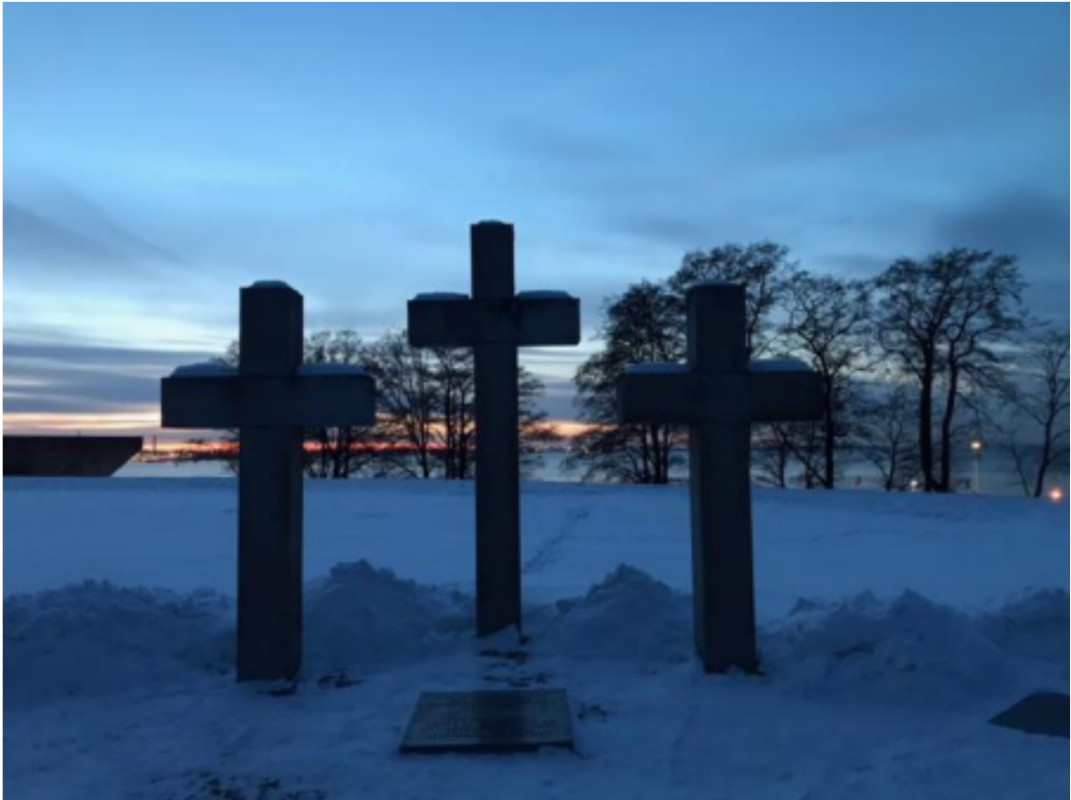
Foto 2. Nõokogue Liidu armees võidelnud sõdurite mälestustuseks