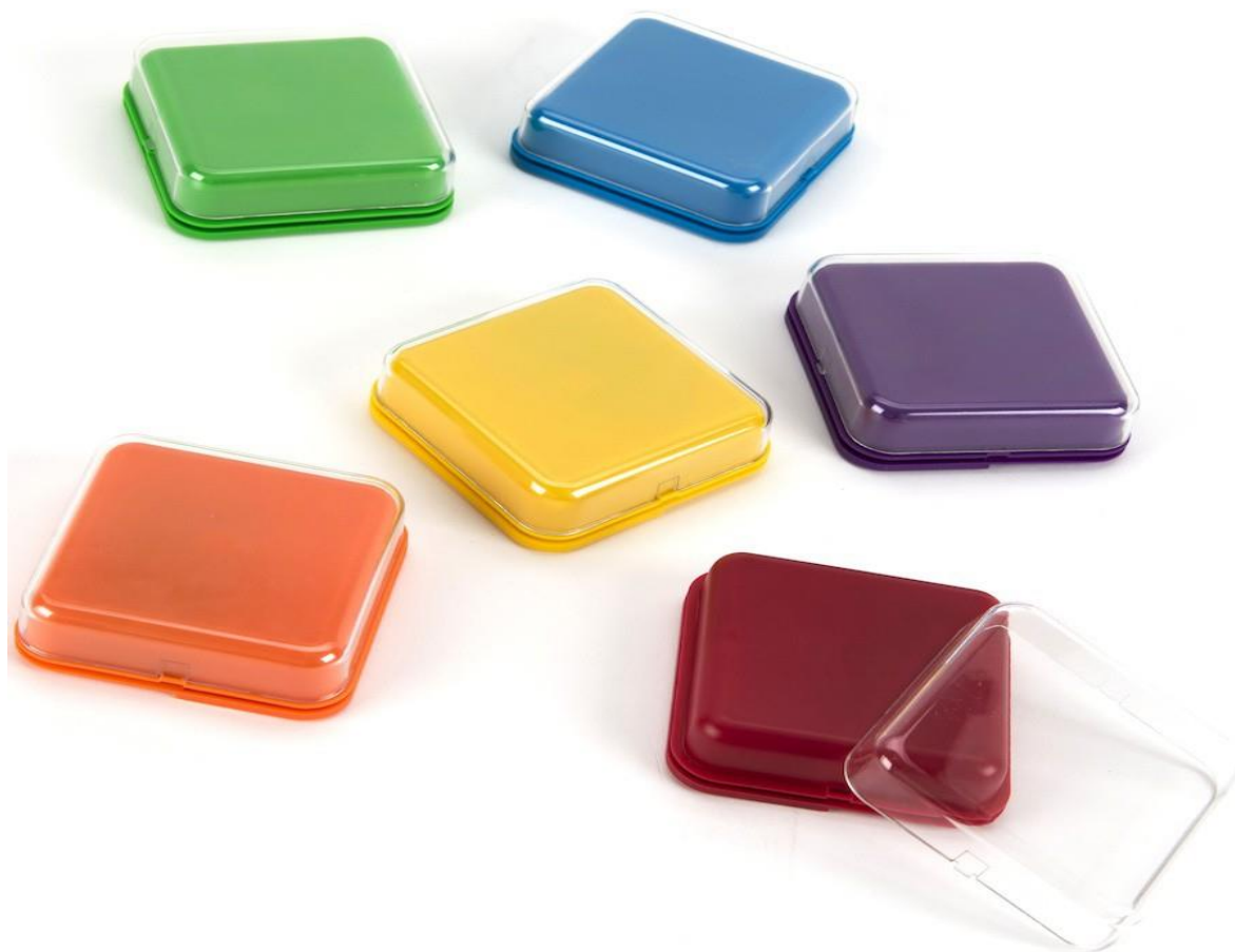
Pilt 2. Pildi allikas: Mänguväljakud