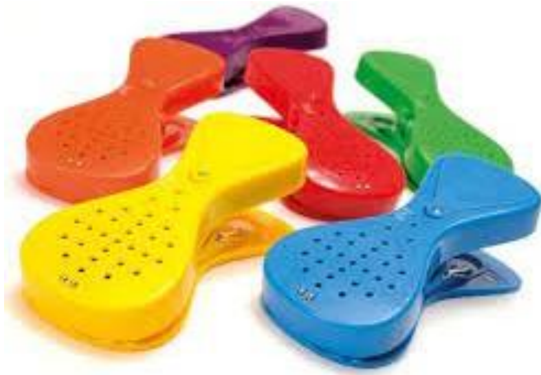
Pilt 1.

koos nende taga peituvate ülesannete lahendamisega. QR-kood tähendab eesti keeles kiiret vastust ja see võimaldab enda alla peita igasugust informatsiooni - alates mängudest, lauludest, videotest kuni ürituste kutseteni välja (juhised QR-koodi lugemiseks ja loomiseks leiad videolt ). Kuid selleks, et näha QR koodi taha peidetud infot, on vaja nutiseadet, kus on toimiv kaamera ja internetiühendus. Läbi loodud õpiloo toimub keeleõpe mänguliselt ja laps on motiveeritud õppima. Samuti lisab põnevust interaktiivsete vahendite kasutamine, mis teeb õppimise lõbusamaks ja huvitavamaks.