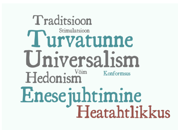
Joonis 4. Meedia pakutud väärtused

Õhinapõhiselt läheneti kõigile uurimisküsimustele äärmiselt hoolikalt ning intervjuud sisaldavad rohkem sisulisi andmeid kui selle uuringu käigus analüüsida suudeti. Tulevikus tasub sarnast uuringut korrata ning seejärel kõrvutada andmeid, et võrrelda väärtuste dünaamikat ajas. Lisaks on oluline tuua teema rohkem pildile, et algatada arutelusid väärtuste tähenduse üle laiemalt. Selle kaudu on võimalik, et ka meie kodudes pööratakse tähelepanu tõe, ilule, õiglusele ja headusele oluliselt enam, et saaksime jääda iseendaks.