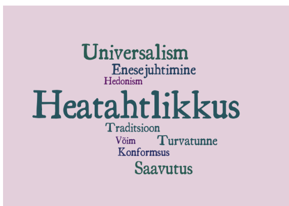
Joonis 2. Intervjueeritavate väärtused