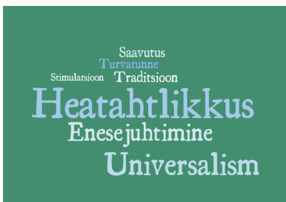
Joonis 3. Autoetnograafilise uurimuse väärtused