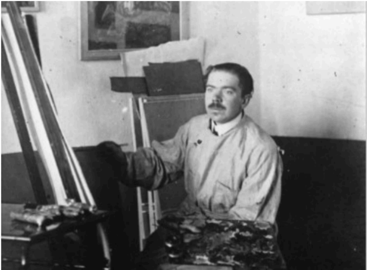
Aleksander Promet.