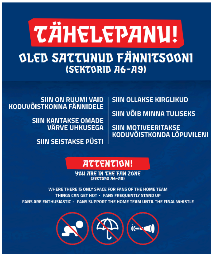
Pilt 1. Reeglite infostend.