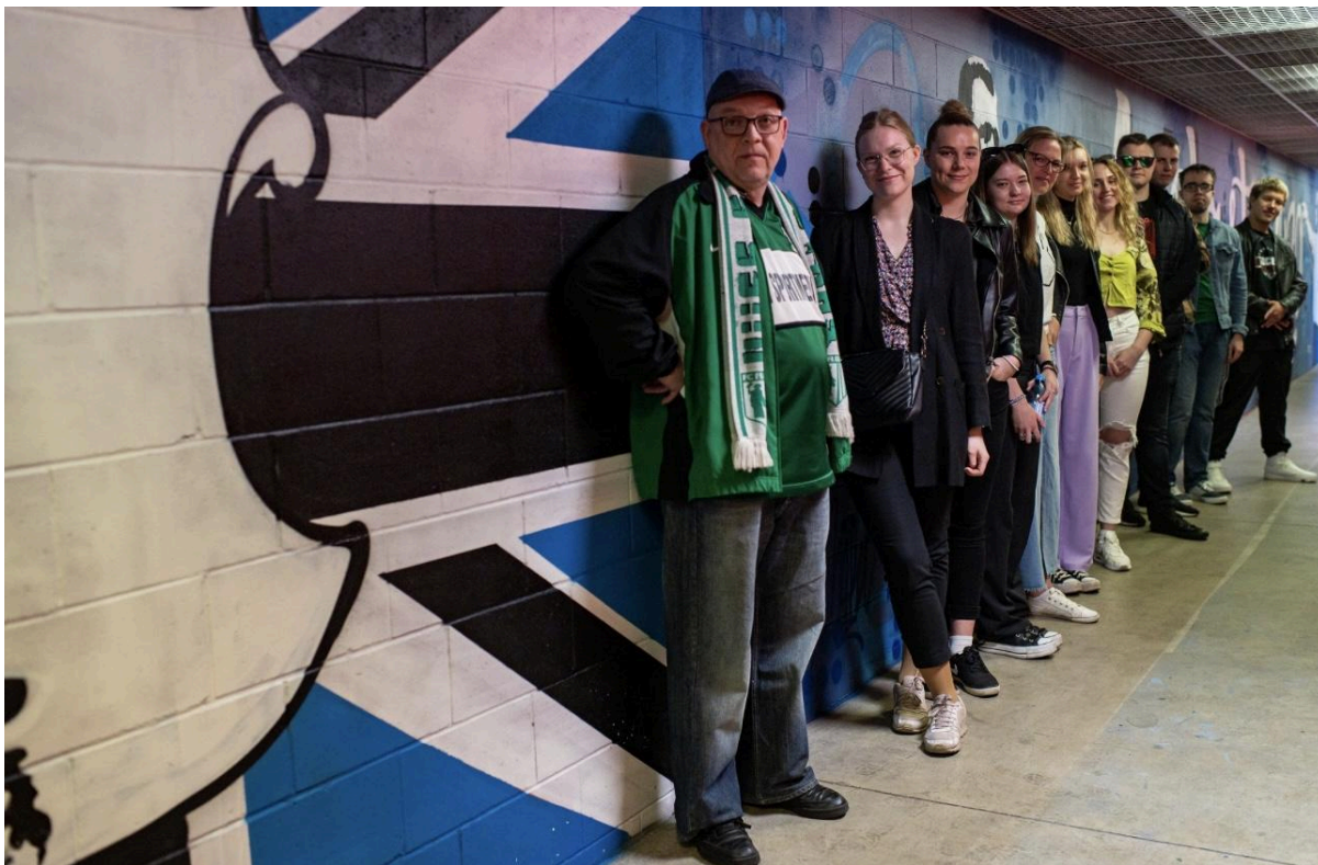
Pilt 3. Meeskond valmis tööga.